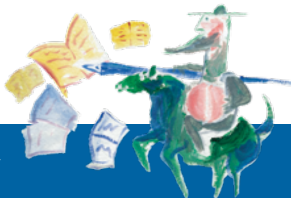
Illustration José David

Pour en savoir plus sur le Prix Prescrire (règlement, présentation, interventions, etc.), rendez-vous sur le site internet www.prescrire.org