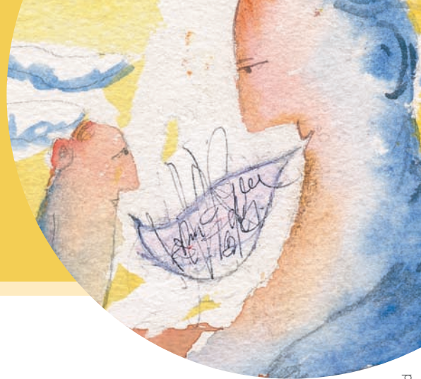
Illustration José David

Parmi les ouvrages et documents analysés dans les numéros 432 à 440 de Prescrire (octobre 2019 à juin 2020), la Rédaction a attribué le Prix Prescrire 2020 à ces trois lauréats :